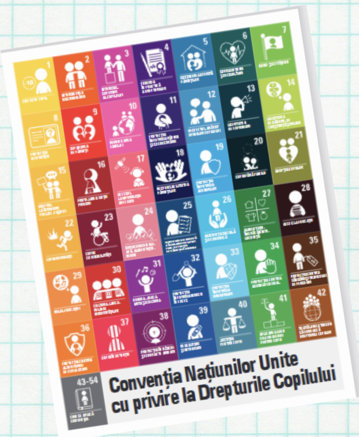
Convenția privind Drepturile Copilului (varianta prietenoasă copilului)

se regăsește în documente legislative naționale și internaționale